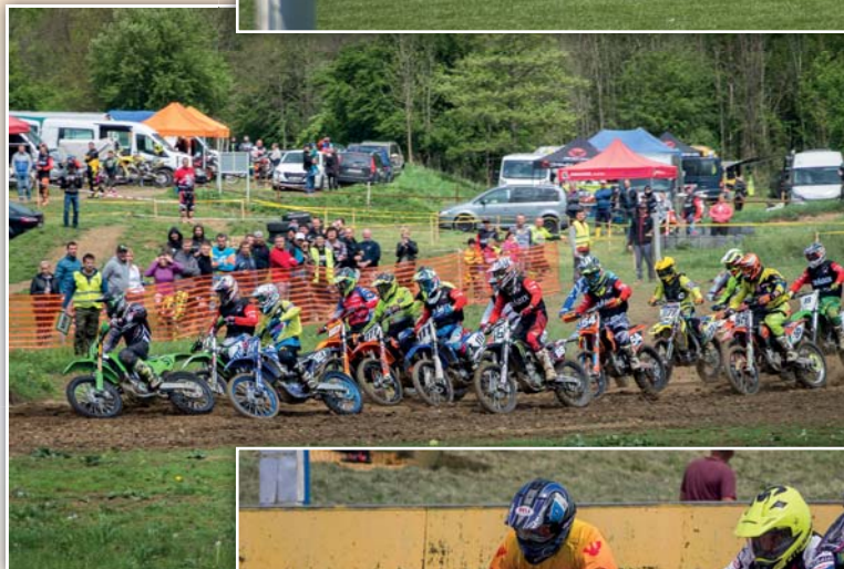
Motocross – Slováký pohár