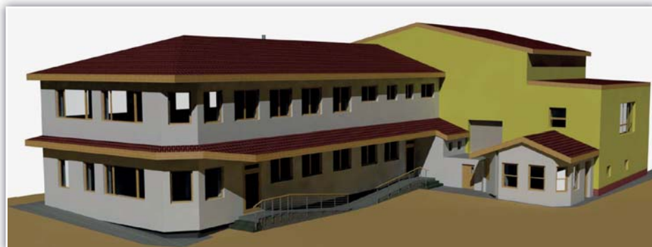
Perspektiva výstavby nových kabin