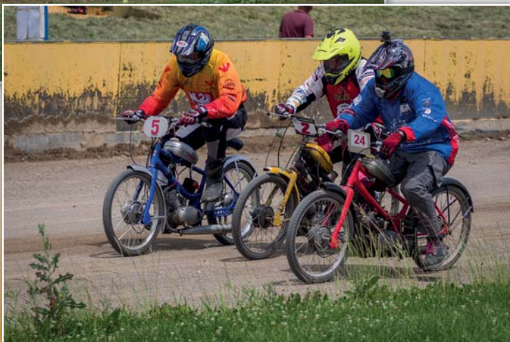
Moped – cup