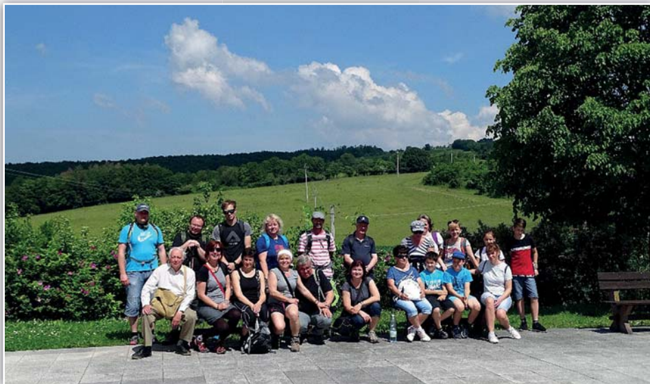
Farní pouť na Provodov - skupinka pěších poutníků při zastávce na Březůvkách