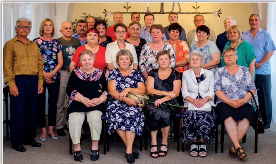
Blahopřejeme milým jubilantům - ročníku 1949.