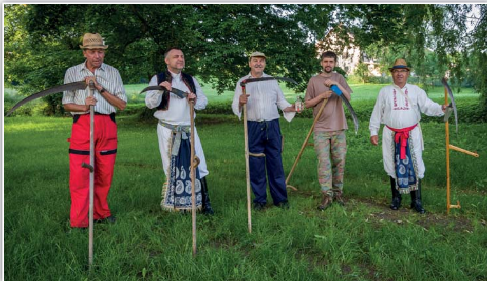
Kosení trávy - sekáči a snídaně připravená členkami Klubu seniorů