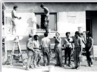
Fotbalová brigáda v kabinách v 70. letech 20. století

Pohyb financí může kdokoli na zmíněném účtu sledovat na adrese: https://www.csas.cz/cs/transparentni-ucty#/020001-1546874329/SK-Brezolupy . SK tímto děkuje všem sponzorům a příznivcům, kteří by chtěli tento záměr podpořit.