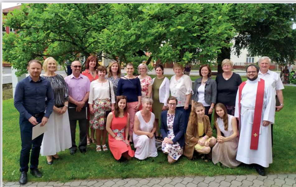
O svatodušní neděli na závěr velikonoční doby zazpíval při mši sv. Chrámový sbor Březolupy.