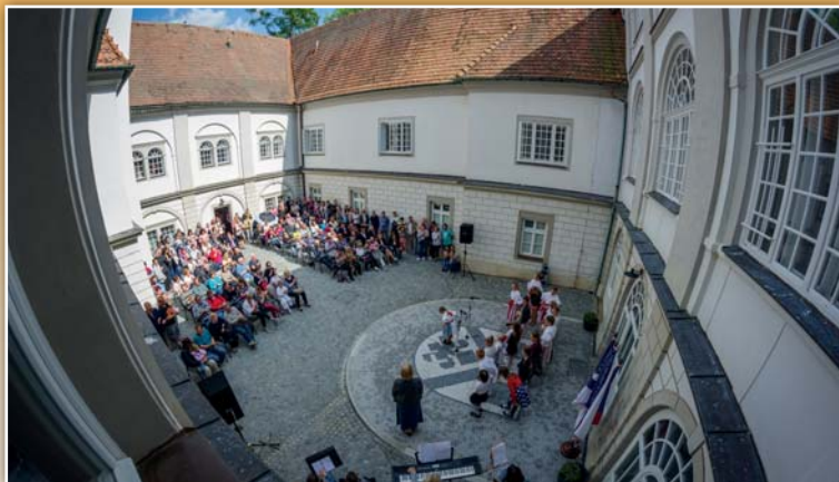
Slavnostní otevření nádvoří brezolupeckého zámku