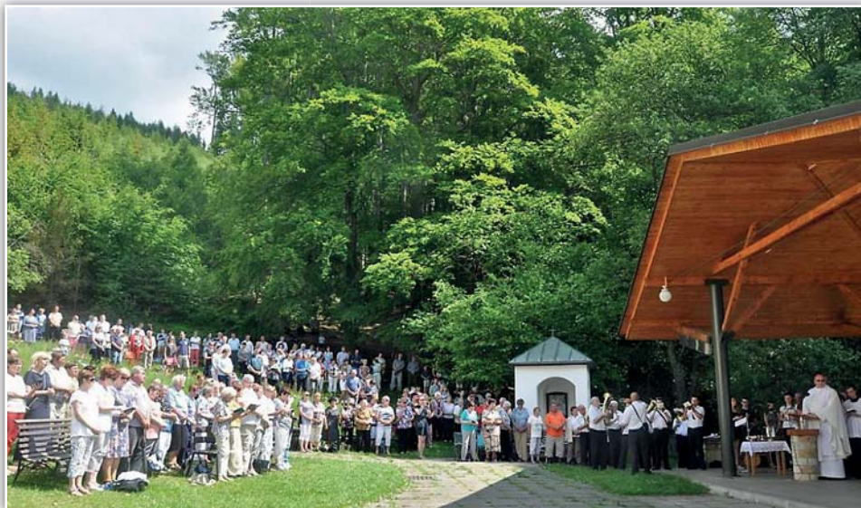
Poutní mše sv. březolupské a bíloviceké farnosti na Provodově