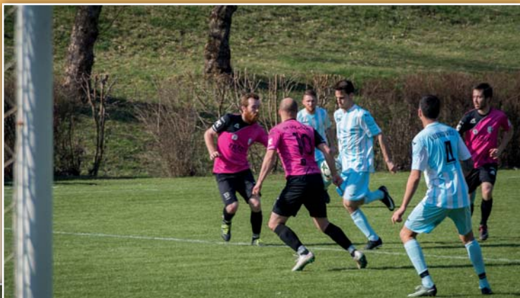
Fotbalový zápas s Ludkovicemi