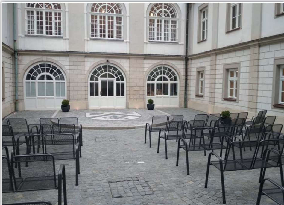
Nádvoří po rekonstrukci

V nedávno minulé době nebyla péče o památky prioritou, a proto chátralo nejen vnitřní vybavení, ale i fasáda. Obec Březolupy po roce 1989 se o svůj majetek již starala lépe, ale samozřejmě v mezích svých možností. Nejdříve byla opravena fasáda a střecha zámku. Poté byly roku 2004 restaurovány oba alianční znaky, ostění dveří i schodiště z rozpočtu obce. Na závěr v roce 2018 byla s využitím dotací vyměněna okna a zatepleny stropy a ve stejném roce z vlastních prostředků provedena rekonstrukce nádvoří zámku.